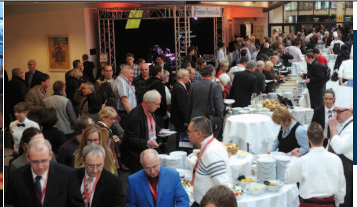
Die Kaffeepausen wurden von der ACADEMY Holding AG und ihrer Tochterfirma DATAPART gesponsert, das Mittagessen spendierten die TÜV Hessen, NORD, Rheinland, Saarland, SÜD und Thüringen

beziehungsweise unfreundliche Gesichter und „der erste Eindruck“ haben. „Alles ist eine Botschaft“, so Häusel. Und mit diesen Botschaften sollten Fahrlehrer „sauber arbeiten“ (siehe auch Seite 30/31).