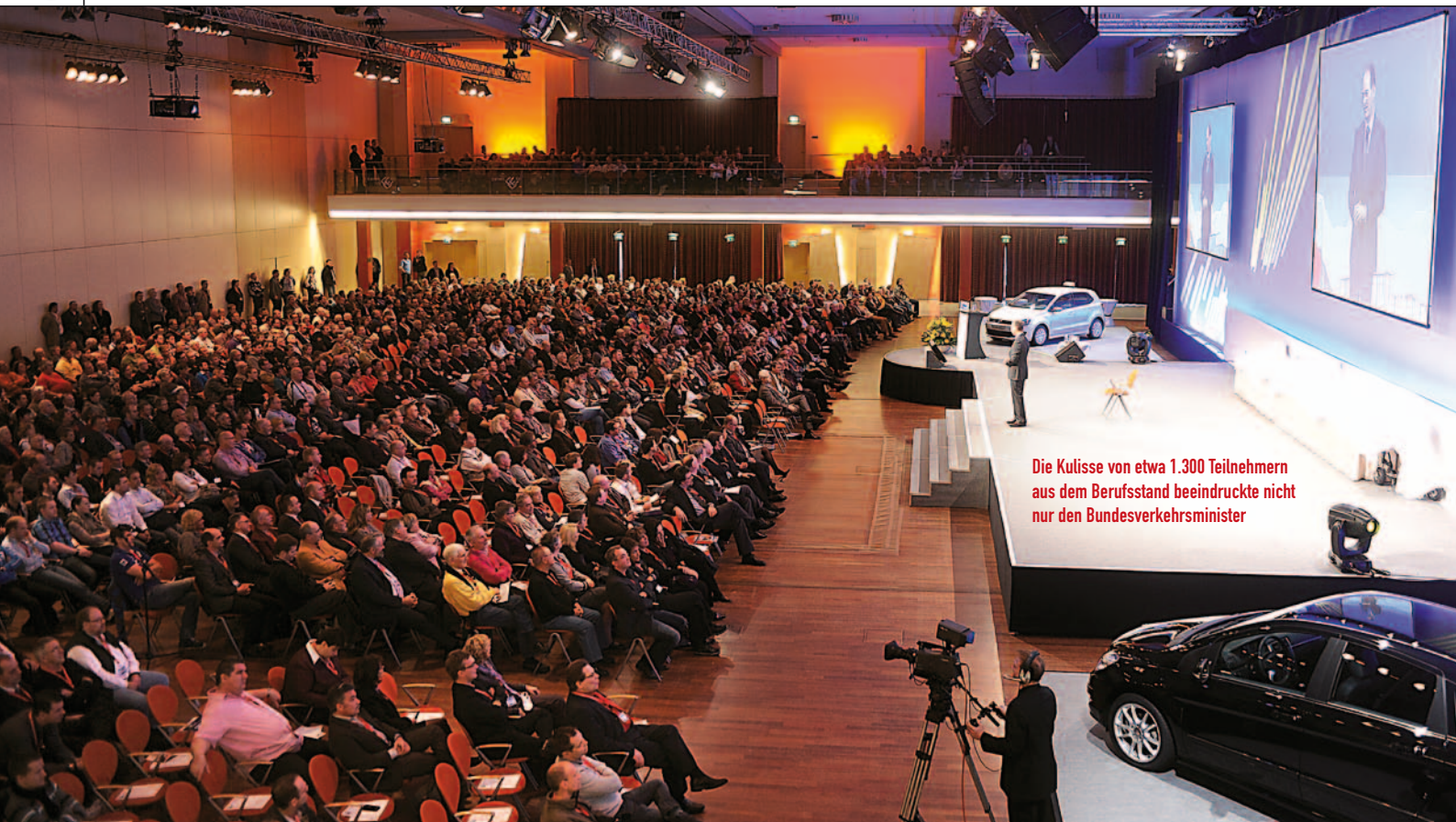
Die Kulisse von etwa 1.300 Teilnehmern aus dem Berufsstand beeindruckte nicht nur den Bundesverkehrsminister