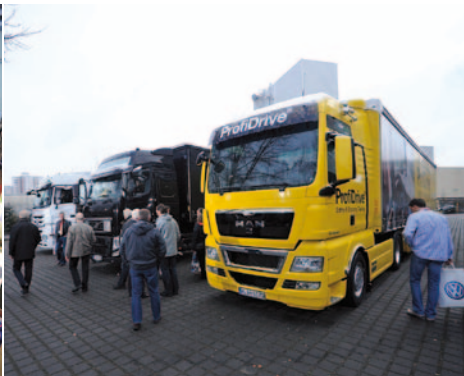
Die Ausstellung im Innen- und Außenbereich war schon „eine kleine IAA“, kommentierte ein Teilnehmer im Bewertungsbogen

auf das kontinuierliche Senken der Unfallzahlen über einen langen Zeitraum hinweg sein dürfen. Mit seinem Hinweis auf den gewaltigen Bildungsauftrag, den Fahrschulen erfüllen müssen, verband er einen konstruktiv-kritischen Hinweis, den die Fahrlehrerverbände schon seit langem predigen. Der Bundesverkehrsminister verlangte „Qualität statt Preisdumping“ und merkte an, dass er als Kaufmann die Preisgestaltung in manchen Fahrschulen nicht nachvollziehen könne.